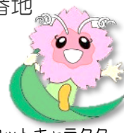
マスコットキャラクター 風花ちゃん

名東区在宅サービスセンター(上社ターミナルビル2階) (名東区社会福祉協議会 名東区介護保険事業所) 名東区北部いきいき支援センター