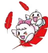
愛ちゃんと希望くん