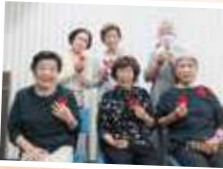
▲もみじの会のみなさん

街頭募金で、通常は募金にご協力いただいた方へ赤い羽根と絆創膏をお渡ししています。今年は、ボランティア団体さんのご協力でも糸で編んだ赤い羽根とハートモチーフの2種類が加わり大人気でした。作成いただいた「もみじの会」の皆様、本当にありがとうございました!