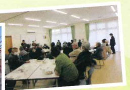
▲演奏に合わせて口ずさみます♪