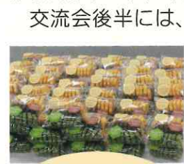
ひまわり福祉会「ひとくちクッキー」をおみやげに

この交流会は名東区ボランティア連絡会主催のイベントで名東区ボランティア連絡会に加入している団体さんがブース出展をし、普段の活動紹介等を行いました。