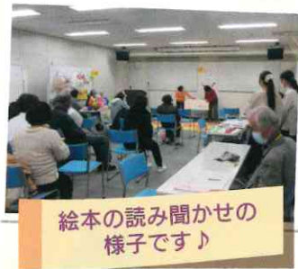
絵本の読み聞かせの様子です!