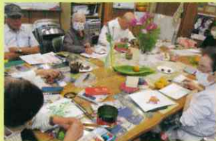
▲題材の乗った大きな テーブルをみんなで囲みます

続々といらっしゃる参加者に、代表の方が明るく声を掛けます。今日描きたい題 材(お花や小物)を参加者で持ち寄り、画用紙や絵の 具等準備ができた方から絵を描いたり、ぬりえをさ れている方も。絵を描きながら、題材の話や世間話・ 昔話等、好きなタイミングでお話ができます。おしゃ べりを楽しむもよし、黙々と絵に没頭するのもよし! 参加者からは、「月1回なので楽しみで無理なく来られる。」 「ホッとしに来ています。」との感想をお聞きました。暖か みのある芸術と、にぎやかな会話あふれるサロンでした。