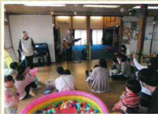
歌の時間は牧師さんがギターを演奏して下さいます。歌に合わせて子どもたちも手をたたいたりとはしゃいでいます!

暖かいスタッフと沢山の友達、自由にはしゃげる空間の揃った魅力的なサロンでした!気になる方はぜひお立ち寄りください!