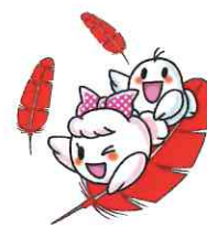
愛ちゃんと希望くん ©中央共同募金会