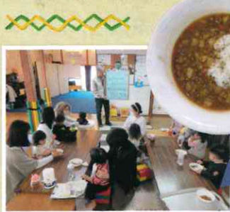
お昼にはカレーをいただきました。赤ちゃん用のものもあり、どの子どももばくばくおいしそうに食べています。おかわりする子ども!