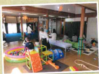
寄附等で集まった遊具やおもちゃやお友達がいる空間で子どもたちの遊びの幅が広がります!