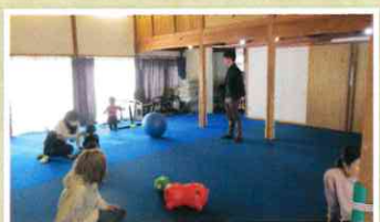
広いスペースで元気に走り回る子どもたち。柱には角を保護する対策がされており、安全への配慮が感じられます!

教会の集会場に子どもたちの元気な声や、お母さんお父さん方のにぎやかな話声が響きます。今回は教会で開かれている子育てサロン『こどもひろば』に伺いました。