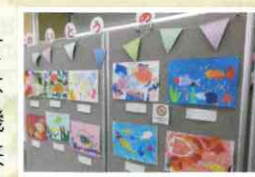
今回はお魚やひまわり等夏らしい作品も♪

出展者1人1人の世界観や考え方をアートを通して「する」ことができます。出品をされた方からは「普段は絵を描かないが、展示できるチャンスがあると描く機会が出来て嬉しい」と伺いました。主催者からは、「来年度以降も開催をしながら、少しずつより良いものへ育てていければ」と意気込みも伺うことができました。