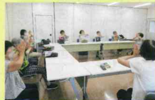
▲ハッピーバースデーの歌で お祝いし、盛り上がりました♪

最後はわいわいおしゃべり。今月、誕生日の方の 近況報告や、初参加の方の感想を聞いたりと、 色々な話題について皆でお話をされていました。 サロン名の通り、参加者一人一人が楽しく『おしゃ べり』できるような、活気のある集いの場でした。