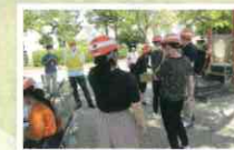
各事業所から職員・利用者・地域の方も協力して公園まで避難

今回が初開催であり、合同避難訓練にすることで災害時の対応に必要な「自助」だけでなく、「共助」についても考えながらの訓練です。施設や地域の方も巻き込んだ訓練という事で、もしもの時に必要な「顔の見える関係作り」を意識できる訓練となりました。