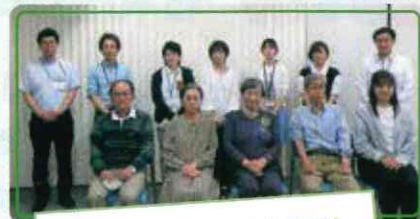
「みんなが子どもを育むまち」 第3ワーキンググループ