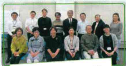
「みんなを支えあえるネットワーク」 第2ワーキンググループ