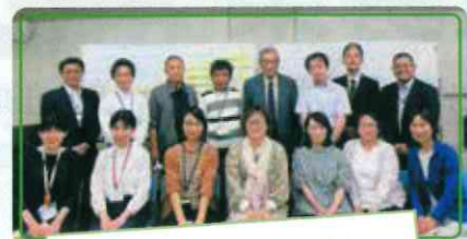
「みんなが活躍できる」 第1ワーキンググループ