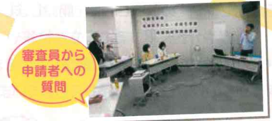
審査員から申請者への質問

6月10日(土)には書類選考を通過した8団体が審査会に参加し、プレゼンテーションやヒアリングで各団体の目指す支援活動など、事業の必要性などを訴えておられました。どの企画も子どもや子育て中の方に「身近にあるといいな」と思う事業で、今後の展開が楽しみな内容でした。