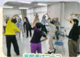
高齢者はつつつ長寿推進事業の実施