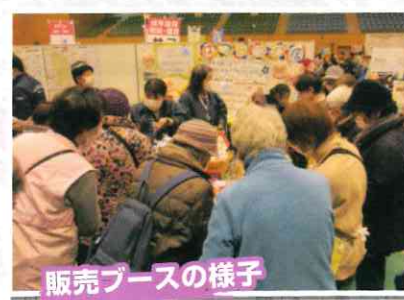
販売ブースの様子