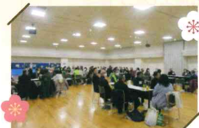
▲区民還暦交流会の様子

終演後、「区民還暦交流会」と題して参加者同士の交流と、学区との顔のつながりづくりの場を設けました。企画運営は、地域デビューを応援する地域福祉活動計画の委員の皆さんです。各学区に分かれグループとなり、自己紹介や学区情報を共有するなど久々に会う同級生ということもあり、和気あいあいと交流しました。