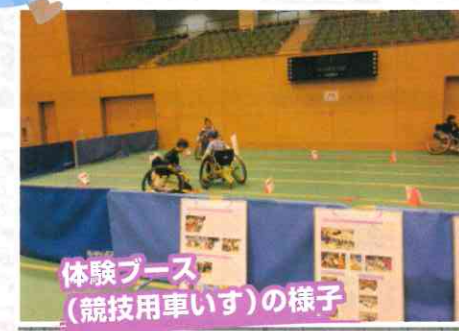
体験ブース(競技用車いす)の様子