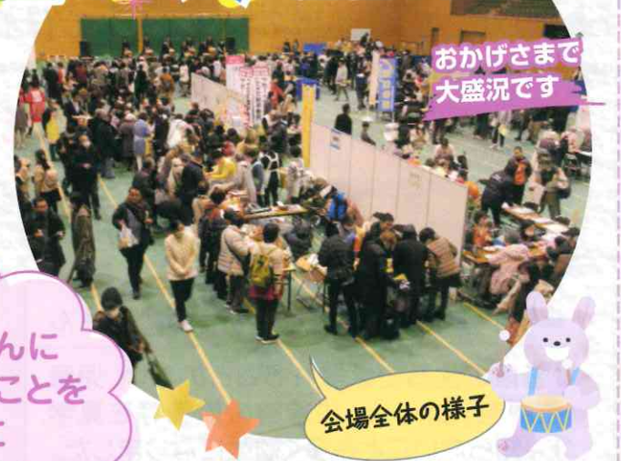
おかげさまで大盛況です

2月25日(日)に名東スポーツセンターで開催し、雨が降り気温も低い中でしたが、約1700名の方にご来場いただき盛況のうちに終わることができました。ステージ・模擬店・バザー・体験ブースと多くの方に楽しんでいただくことができました。