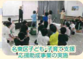
名東区子ども・子育て支援 応援助成事業の実施