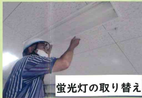
蛍光灯の取り替え